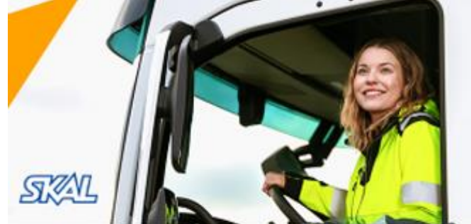
SKAL-UUTISKIRJE JÄSENIILE 31.8.2022